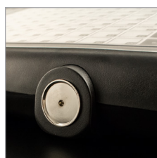
Integriertes Dallas Kellerschloß