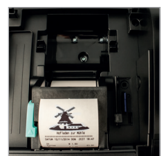
Schneller und leiser Thermodrucker